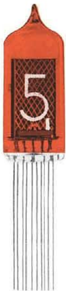
ZM 1136 R