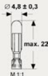
T 5,5 k