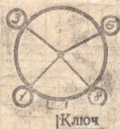
Схема соединения электродов с выводами

Манометрический термопарный преобразователь ПМТ-4М предназначен для преобразования изменения давления газа в электрический сигнал.